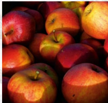
Elstar. Klassisk, hollandsk æble fra 1955. Stor, aromatisk smag og lang holdbarhed men desværre modtageligt for skurv.