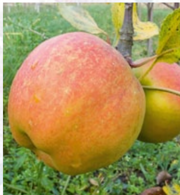
Resista. Nyt, skurvresistent, gult æble, der minder om Golden Delicious. Et liggeæble til vinterbrug.

Ellers består vedligeholdet af beskæring og renholdning. Væk med ukrudt, larvespind, kræft og andre svampesygdomme og væk med grene der gør træerne tætte og lukkede. Så får man gode, modne æbler.