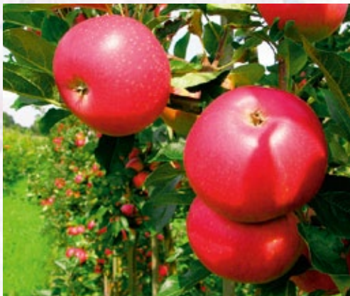
Discovery. Klassisk, engelsk sommeræble fra 1949. Rundt med lyserødt kød.