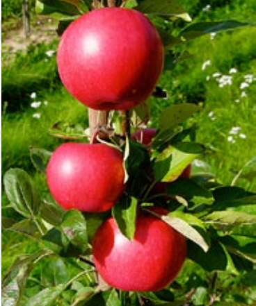
Collina. Nyt, hollandsk sommeræble, aromatisk og sart i smagen.