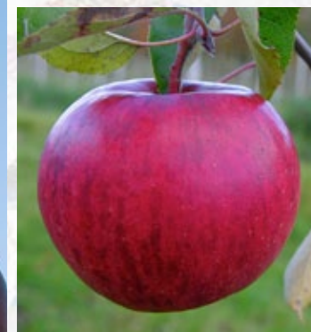
Angold. Nyt vinter-lageræble baseret på den russiske sort Antonovka. Sprødt langt ind i foråret.