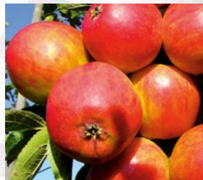
Holsteiner Cox. Tysk krydsning fra 1918 med Cox Orange i blodet. Smag stor, aromatisk og syrlig.