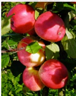
Ahrista. Skurvrsistent, tysk æble fra 1999 med mild smag.