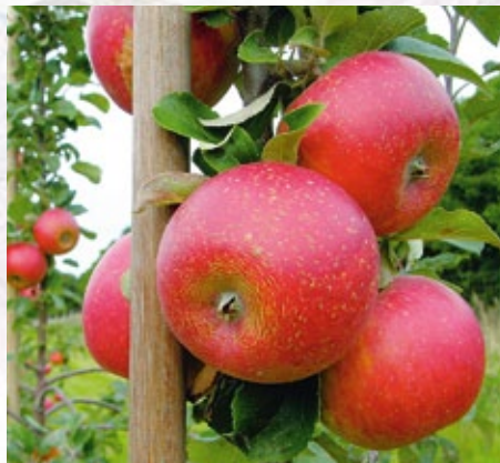
Alkmene. Tysk æble fra 1930 med rødder i Cox Orange. Aromatisk.