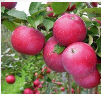
Aroma. Svensk krydsning mellem Filippa og Ingrid Marie. Syrligt og meget saftigt.