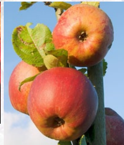
Belle de Booskop. Måske æblet med den kraftigste smag. Super til madlavning men som velmodnet også et udfordrende spiseæble.