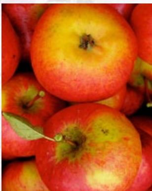
Rubinola. Tjekkisk, skurvresistent æble fra 1980. Aromatisk med gulligt kød.